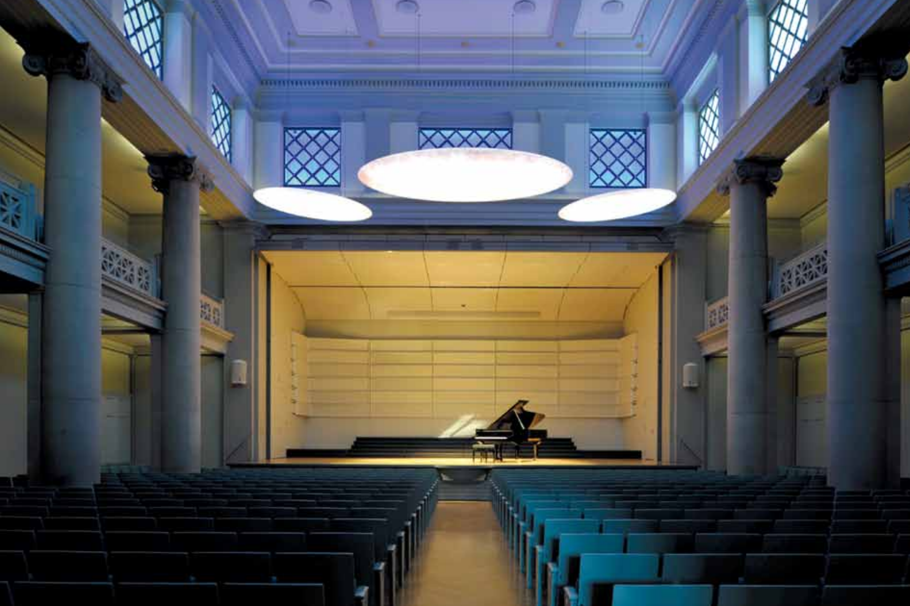
^Ein ehrwürdiger Saal für ein ehrwürdiges Orchester: Der Stadthausaal in Winterthur ist ins beste Licht gerückt.