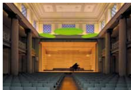
<Je nach Musikstück können die Ellipsoide in unterschiedlichen Farben leuchten.